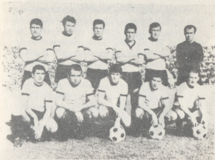
Отборът на „Тракия“ — Пловдив

— Имате ли преки контакти с футболистите?